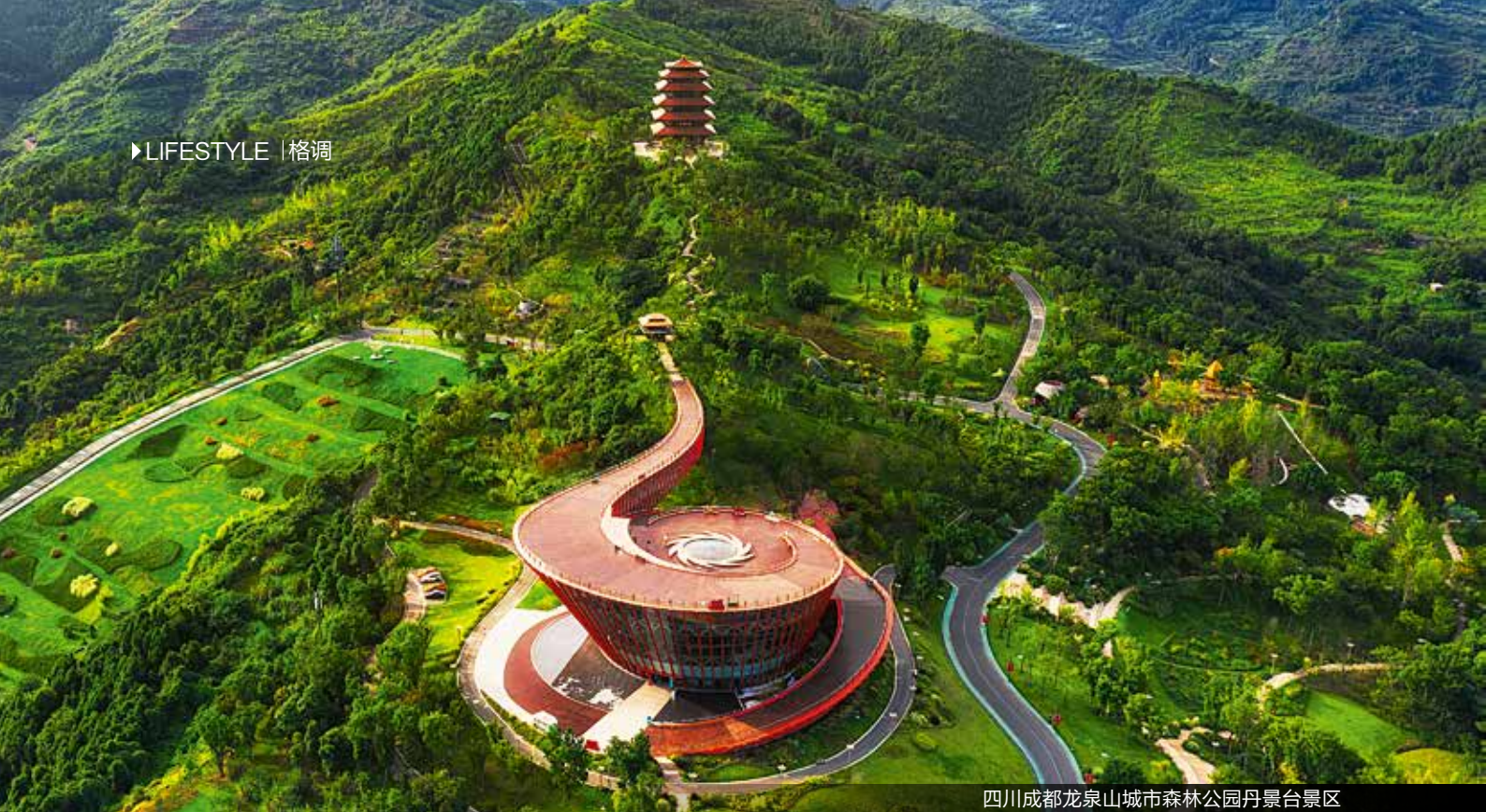
四川成都龙泉山城市森林公园丹景山景区

三是要进一步强化智慧、韧性、精明、包容，来重塑城市发展的高级形态，像成都这样的历史文化古城必然面临着存量空间和增量空间的优化重组和功能业态的重塑。