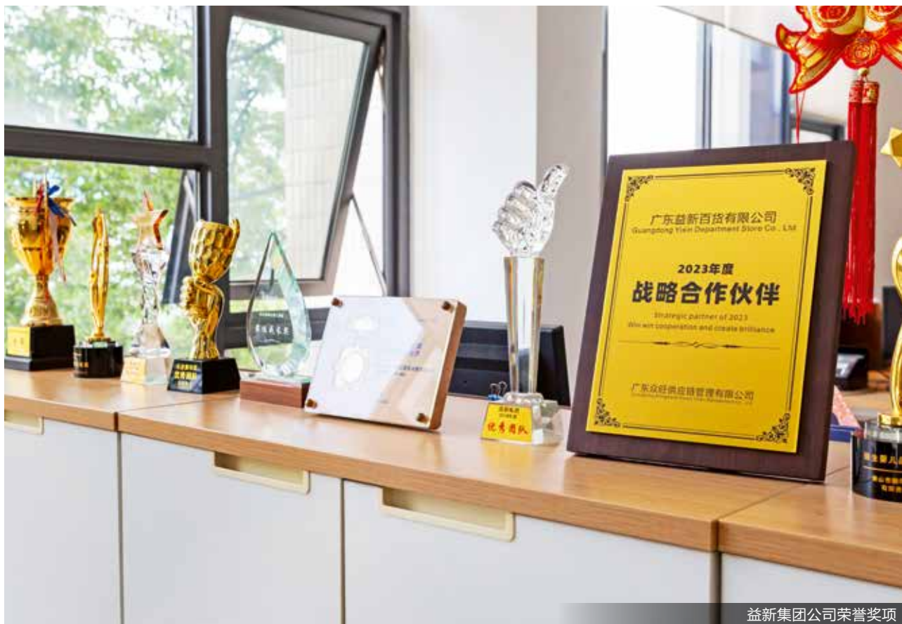
益新集团公司荣誉奖项

目前，“黑旋风”品牌灭杀蟑螂的产品已接近 20 种，主要是杀虫剂、饵剂、蟑螂屋和气雾剂四大品类。