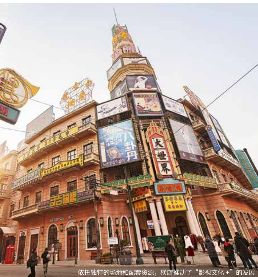
依托独特的场地和配套资源，横店推动了“影视文化+”的发展

需要注意的是，要实现这一目标，影视基地还需要满足一系列基本条件。例如，当地的地理环境、交通设施、人才储备等因素是否具备优势？是否足以支撑影视项目的“规模化”发展？在启动影视基地建设之前，应进行充分的市场调研和科学评