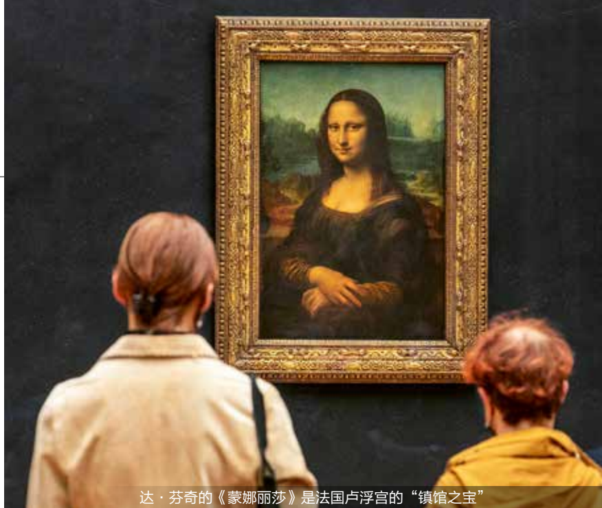
达·芬奇的《蒙娜丽莎》是法国卢浮宫的“镇馆之宝”

在今天，越来越多的人爱上了博物馆。因为它承载了太多的人类文明的积淀和回响，于是，逛博物馆也成为一段不断发现的“旅行”。据国家文物局发布的相关数据，2023 年我国博物馆接待观众 12.9 亿人次，创历史新高；举办展览 4