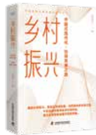
《乡村振兴——中国式现代化·协调发展之路》