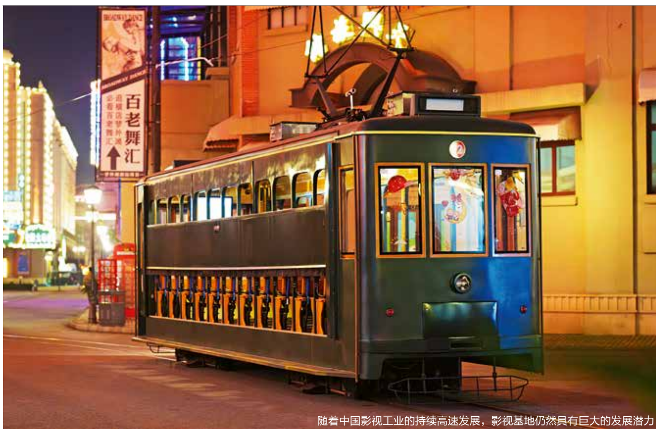
随着中国影视工业的持续高速发展，影视基地仍然具有巨大的发展潜力