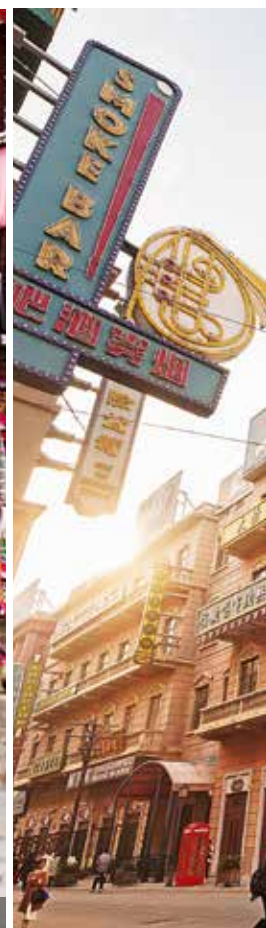
借助影视 IP，横店影视城成为游客拍照打卡地