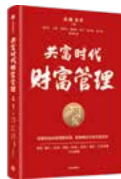
《共富时代财富管理》

再次,吸引社会人才回归乡村。例如,鼓励原籍普通高校和职业院校毕业生、外出农民工及经商人员回乡创业兴业。推进大学生村官与选调生工作衔接,鼓励引导高校毕业生到村任职,扎根基层,发挥作用。建立城乡人才合作交流机制,探索通过岗编适度分离等,推进城市教科文卫体等工作人员定期服务乡村。允许农村集体经济组织探索人才加入机制,吸引人才,留住人才。加快发展人力资源服务业,把服务就业的规模和质量作为衡量行业发展成效的首要标准。■