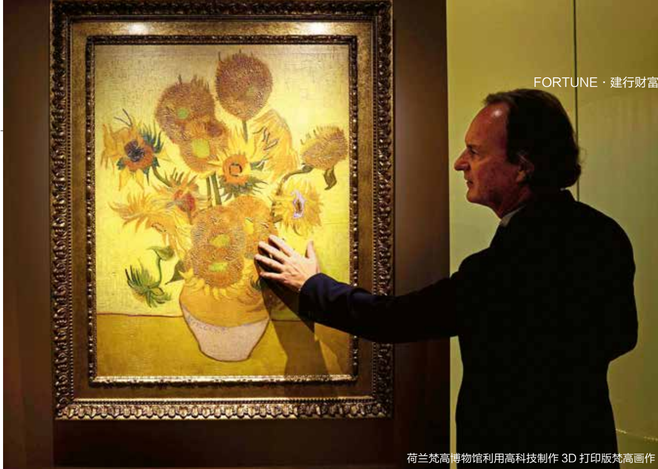
荷兰梵高博物馆利用高科技制作 3D 打印版梵高画作

不过，令所有到访者都惊讶的是，埃及博物馆也是目前世界十大博物馆中唯一没有空调系统的，同时埃及博物馆的保护措施也是少得可怜，到访的游客甚至可以触摸几千年前的文物，当然这并不提倡。网上有人调侃，“因为埃及遍地文物，博物馆保护文物的速度跟不上考古发掘出来东西的速度。”虽然有些夸张，但足以说明埃及博物馆藏品之多，其展示的考古成果代表着一个时代的最高成就。即便是一百多年前，埃及博物馆的规模也令世界惊叹，到如今虽然埃及经济衰退，但埃及博物馆仍位居世界十大博物馆之列。