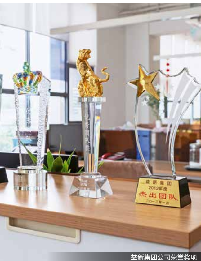
益新集团公司荣誉奖项