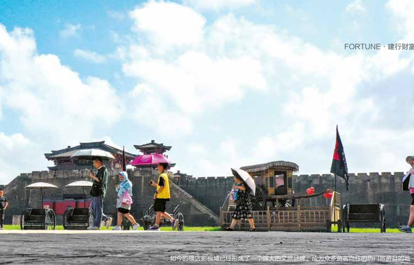
如今的横店影视城已经形成了一个强大的文旅品牌，成为众多游客向往的热门旅游目的地

规模自 2020 年起一直呈上升趋势，2023 年中国网络微短剧市场规模高达 373.9 亿元，同比增长 267.65%。启信宝发布的《2023 年短剧产业区域版图》显示，截至 2023 年 12 月，短剧相关企业超过 30 万家，是 2016 年的近 4 倍。从省份看，北京（4.3 万家）、广东（3.1 万家）、浙江（2.8 万家）短剧企业存续数量位居前列。