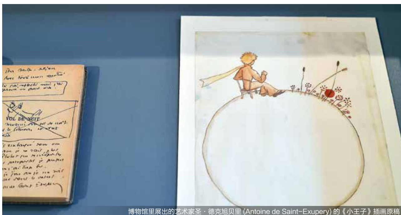
博物馆里展出的艺术家圣·德克旭贝里 (Antoine de Saint-Exupéry) 的《小王子》插画原稿

中法之间多年来积极推动语言学习、学者交流和学术合作，丰富了两国之间的文化交流内容，加深了中法两国人民之间的文化了解与友谊。这种互相学习、相互借鉴的文化交流不仅增进了两国人民之间的情感联系，也共同为人类文明的进步和世界文化的多样性做出了贡献。 ■