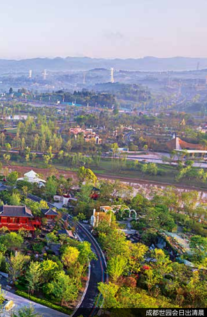
成都世园会日出清晨

可复制、可推广的经验，已经在全国推广。”住房和城乡建设部总经济师杨保军此前如此表示。