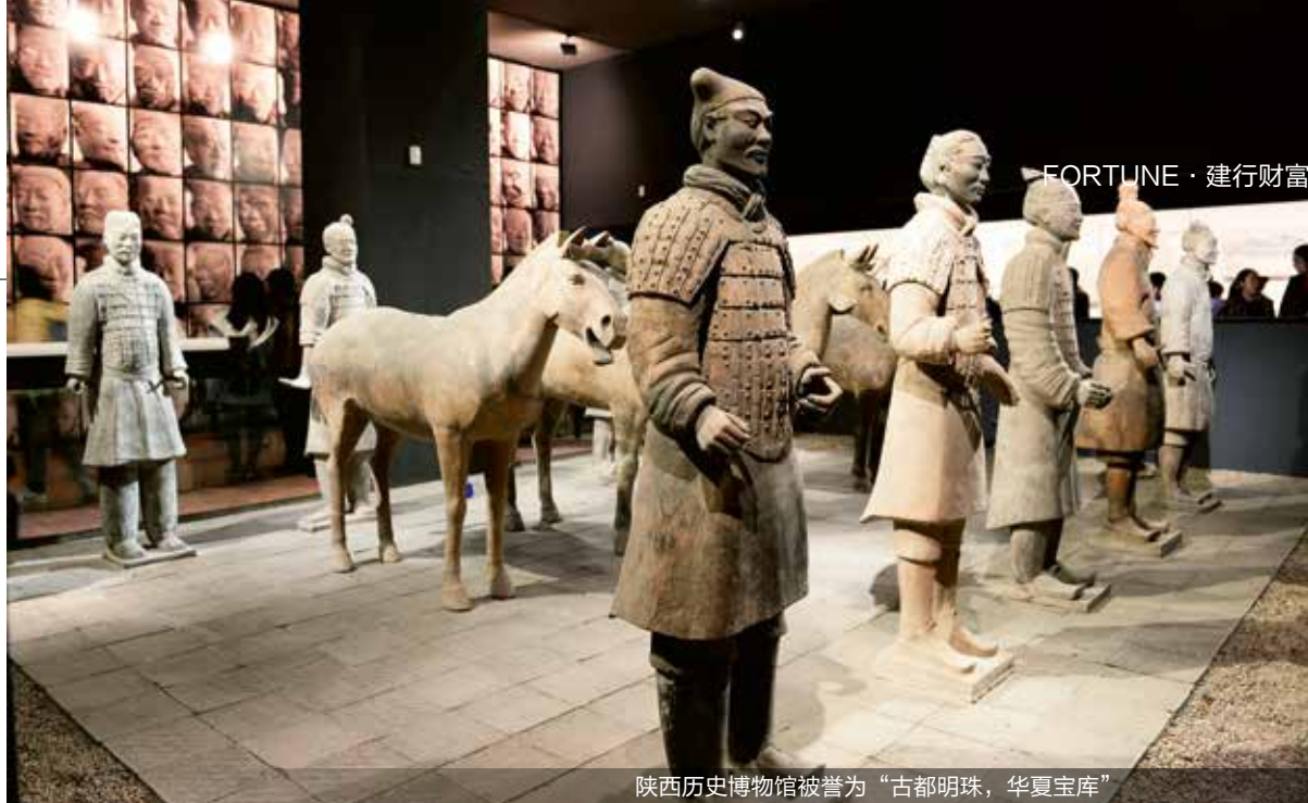
陕西历史博物馆被誉为“古都明珠，华夏宝库”

魂；另一方面，颇具趣味和内涵的展览代表了一个博物馆的风格和气质。不同于杂货铺的陈列，博物馆的展览通常是需要学术力量的内涵和策划，以及对藏品的深度研究，才能让同一藏品在不同主题的展览中焕发新的光彩与生命，这不仅不会让博物馆沦为藏品的仓库，而且会使其最大限度地展现藏品的魅力，让博物馆更多样化地连接社会与公众。