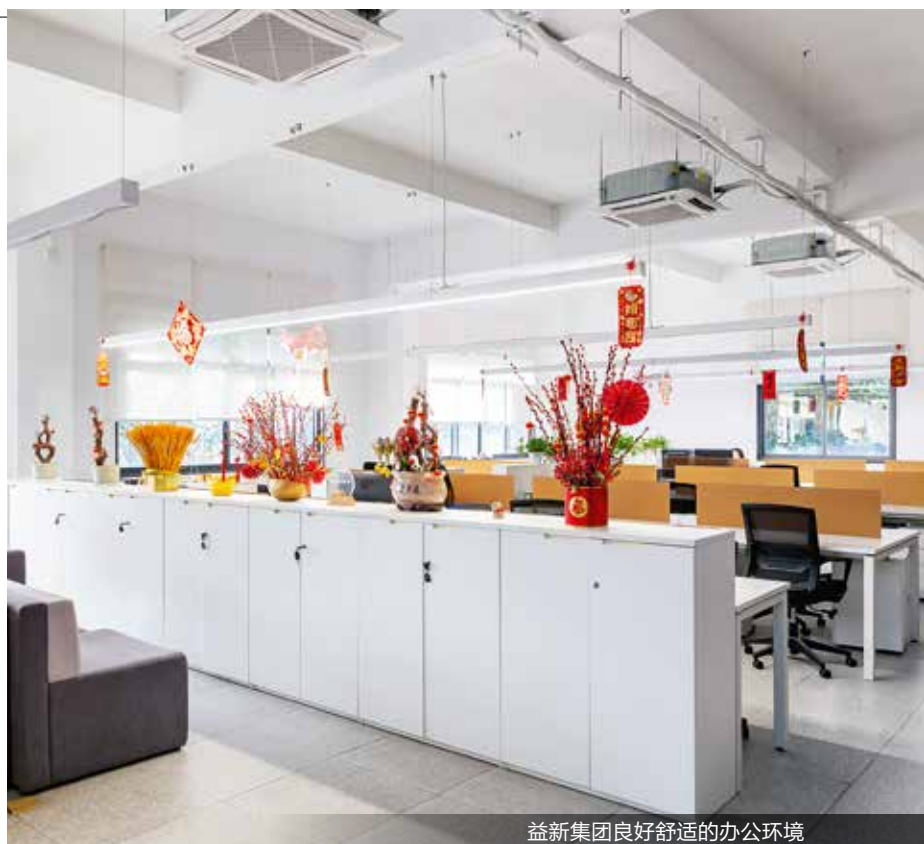
益新集团良好舒适的办公环境