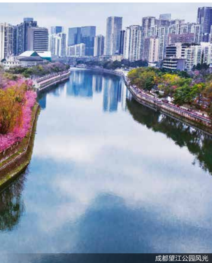
成都望江公园风光

在高国力看来，应该探索符合成都市情的、践行新发展理念的公园城市。其主要应该具有三方面的特征：一是公园城市的建设要充分顺应人民对美好生活的向往，所以整个公园城市建设逻辑起点和根本归宿体现在空间布局、社会治理、环境营造、生态建设以及相关配套产业的选择；二是要以遵循新发展理念来全面提升城市新型竞争力，这是一个不断动态深化和挖掘提炼的过程。新时代的新发展理念，为成都的公园城市建设又明确了新的方向；