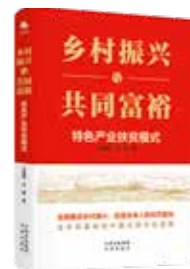
《乡村振兴与共同富裕——特色产业扶贫模式》